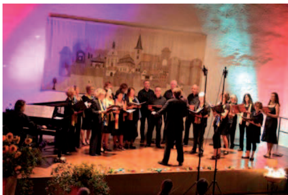
Chor-Konzert Freinsheim 2011