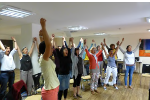
Chorwochenende Bad Bergzabern