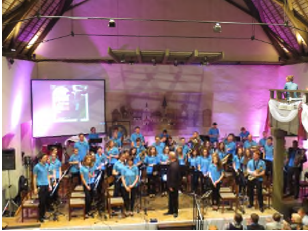
Jugendblasorchester: Valentinskonzert 2014